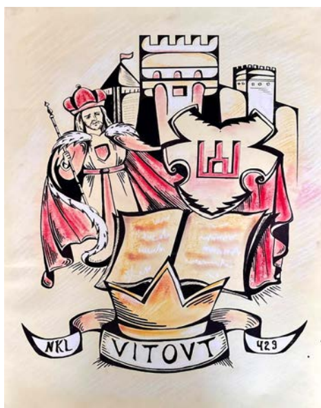
Мал. 7. Вітовт і корона