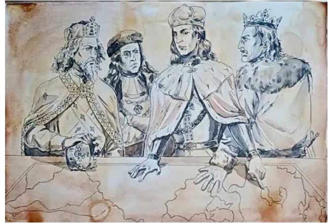
Мал. 3. Вітовт вирішує важливі питання