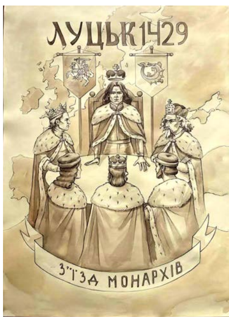
Мал. 2. Луцьк. 1429. З'їзд монархів