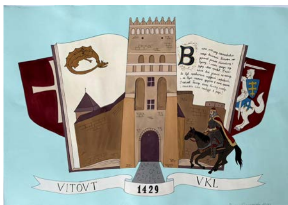
Мал. 6. VITOVTV. 1429. VKL