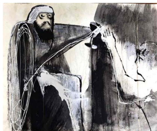
Мал. 8 і Мал. 9. Трагічна подія. Отруєння синів Великого князя Вітовта

Студент створив два варіанти композиції. Це був пошук найбільшої виразності у передачі емоційного стану та ставлення до жорстокості, що вчинив лицар Саненберг «благими» намірами нібито врятувати синів князя Вітовта. Існують різні версії цієї події від заперечення про існування синів-спадкоємців у князя Вітовта до їх життя і страшної загибелі. Художники вивчають історичні події, що намагаються зображувати і довіряють істориком. Головним і важливим у створенні цих варіантів композиції стала емоційна напруга: відчуття біди, болю, несправедливості, жорстокості до дітей. Графічне зображення створено у стилістиці сучасного мистецтва: узагальнені до карикатурності форми, підвищена лаконічність стилізації та використання графічних засобів – пляма, лінія. Розподіл по вісі золотого перерізу, де знаходиться келих з отрутою. Права частина менша за площиною зображення з контуром хлопчика вказує на беззахисність дитини. Ліва частина, більша