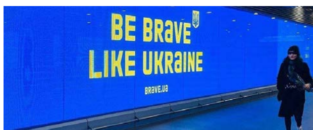
Рис. 3. Банер «Будь сміливим, як Україна». Banda Agency. Be Brave Like Ukraine. Міжнародна комунікаційна кампанія 2022. URL: https://banda.agency (дата звернення: 13.11.2025)