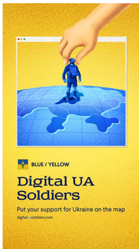
Рис. 5. Плакат для сайту