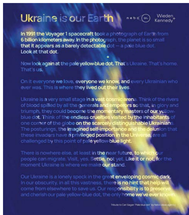
Рис. 4. Постер «Ukraine is our Earth»