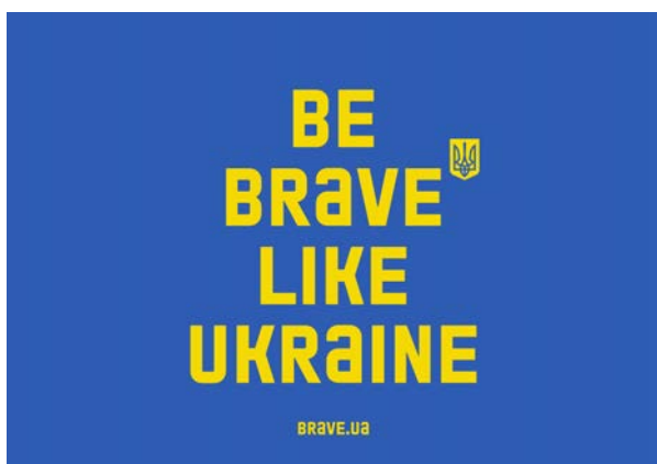
Рис. 2. Білборди «Будь сміливим, як Україна».