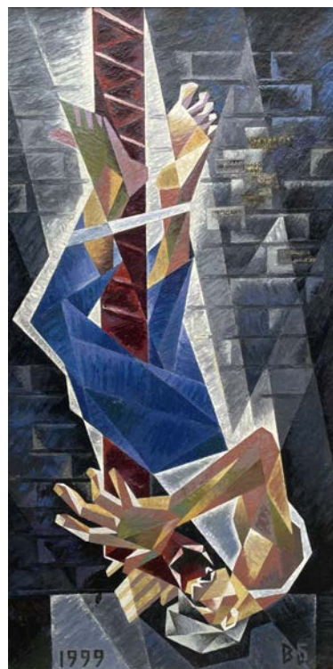
Рис. 4. В. Буйгашев «Ноктюрн» енкаустика, 186x97, 1999 р.

пластичності та стає важливим носієм художнього змісту в роботах: «Засліплений» – образ завойовника Наполеона, 1997 р. та «Отче, прийми мою душу» – портрет розп'ятого Христа, 2000 р. (рис. 5, 6, 7).