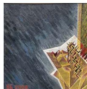
Рис. 5. В. Буйгашев «Засліплений» Рис. 6. В. Буйгашев «Отче, прийми мою енкаустика, 97x97, 1997 р. енкаустика, 100x100, 2000 р.