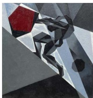
Рис. 2. В. Буйгашев «Вершник»

Рис. 3. В. Буйгашев «Сізіфова праця» енкаустика, 130x120 кв. м., 1996 р. енкаустика, 129x124 кв. м., 2000 р.