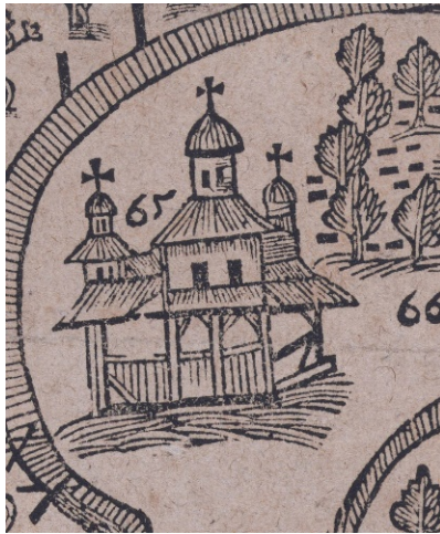
Рис. 1. Зображення церкви Різдва Богородиці на Плані Дальніх печер 1638 року (видання КПЛ, КПЛ-ГР-15)

(опасанням) навколо всього об'єму, розміщена на високій, укріпленій деревом, терасі (Алфєрова Г. В., Харламов В. А., 1982).