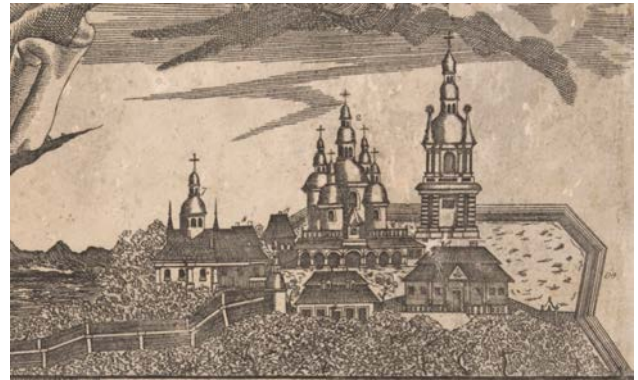
Рис. 2. С. Малютин, Нікон. Гравюра «План Києво-Печерської лаври з лабіринтами печер кінця XVIII ст.» 1821 р. (?), фрагмент. КПЛ-ГР-3931

символізуючи сім дарів Святого Духа. Саме такою церква зображена на гравюрі Леонтія Тарасевича «Печера преподобного отця нашого Феодосія» (1703) (рис. 3.), що спростовує, поширену у науковому просторі, думку про прибудову каплиць у 1767 році [3, с. 1400]. Кожна з означених каплиць сполучена з основним об'ємом вхідним прорізом, утворюючи складну оригінальну у плані конфігурацію, що не має аналогів в Україні.