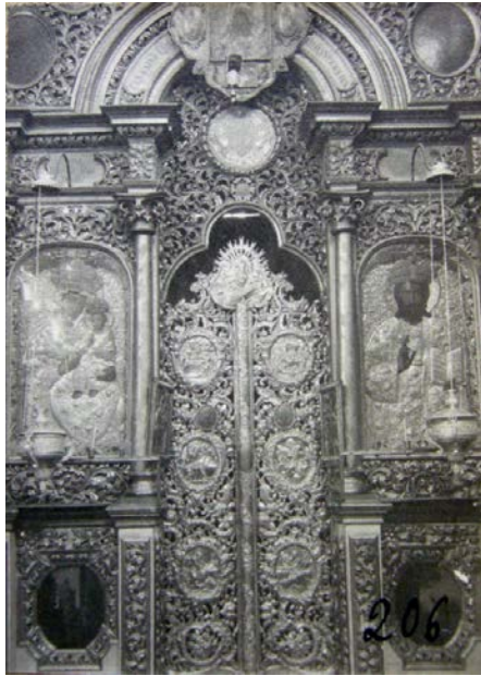
Рис. 4. Фрагмент іконостасу церкви Різдва Богородиці.