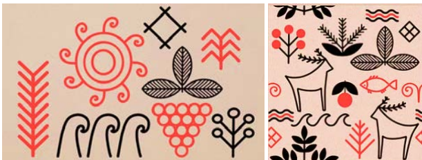
Рис. 3. Цифровi прийоми у етнодизайнi: flat-дизайн i векторна стилiзацiя (автор: CallMeStasia)

Також видзначено застосування принципiв сучасного цифрового мистецтва, зокрема пласкої графiки, декоративної стилiзацiї та елементiв векторного дизайну, що наближує колекцiю до актуальних тенденцiй у сферi вiзуальних комунiкацiй. Це свiдчить про ефективну iнтеграцiю етнодизайну в цифрове середовище та демонструє можливостi переосмислення традицiйної культури засобами сучасної комп'ютерної графiки (див. Рис. 3).