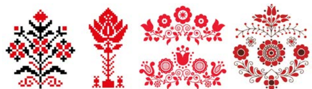
Рис. 5. Стилiзацiя символу «Дерева життя» та традицiйних орнаментiв Житомирщини засобами комп'ютерної графiки

Зазначимо, що пiд час вивчення освiтньої компоненти «Декоративно-прикладне мистецтво та етнодизайн» здобувачi освiти розробили авторськi вiзуальнi композицiї, у яких здiйснено стилiзацiю символу «Дерева життя» та традицiйних орнаментiв Житомирщини засобами комп'ютерної графiки. У процесi дизайн-проектування було проаналiзовано характернi для рiгiону орнаментальнi мотиви Полiсся, зокрема рослиннi елементи, геометризovani форми та ритмiчнi композицiї, якi стали основою для побудови цiлiсного вiзуального образу (див. Рис. 5).