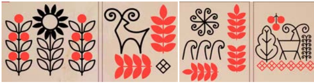
Рис. 2. Стилiстичнi особливостi етнодизайну в цифрових iлюстрацiях (автор: CallMeStasia)

Також видзначено застосування принципiв сучасного цифрового мистецтва, зокрема пласкої графiки, декоративної стилiзацiї та елементiв векторного дизайну, що наближує колекцiю до актуальних тенденцiй у сферi вiзуальних комунiкацiй. Це свiдчить про ефективну iнтеграцiю етнодизайну в цифрове середовище та демонструє можливостi переосмислення традицiйної культури засобами сучасної комп'ютерної графiки (див. Рис. 3).