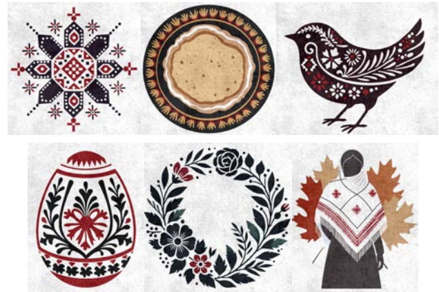
Рис. 4. Вiзуалiзацiя етнодизайну Житомирщини в авторських студентських проєктах (автор: Загоруйко Анастасiя)

Крім того, здобувачі освіти розробили власні дизайн-проекти на основі опрацьованого матеріалу з урахуванням регіональних особливостей етнокультурної спадщини Житомирщини. У створених роботах було використано мотиви традиційної орнаментики Полісся, характерні колористичні рішення, природні образи, символічні елементи, притаманні культурному ландшафту регіону. Застосовано принципи етнодизайну у поєднанні з цифровими технологіями комп'ютерної графіки (див. Рис. 4).