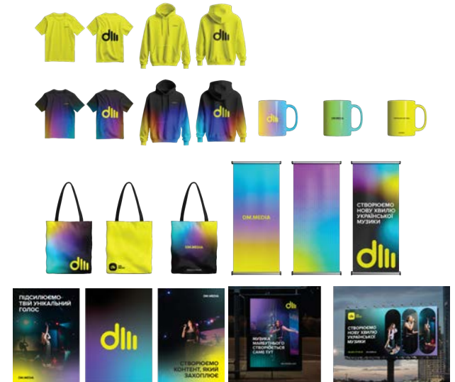
Рис. 4. Елементи мерчандайзингу та offline-комунікації DM.MEDIA. Тетяна Овдійчук