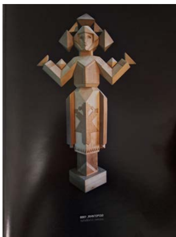
Рис. 2. Берегиня, 1988. Дерево

давнє мистецтво в руках митця трансформується із суто прикладного елемента храмового інтер'єру в самодостатню філософську категорію. Г. Міщенко зазначає, що для І. Фізера, як вихідця із Закарпаття, було важливим «дотримуватись у створенні іконостасу певних канонів його будови техніки різьбярства, сакральної орнаментики, що сформувалися ще в добу середньовіччя» [9, с. 8]. Дійсно, художник сумлінно вивчав творчий досвід майстрів минулого, що дозволило йому досягнути тонкощі культурної традиції оформлення храмового простору.