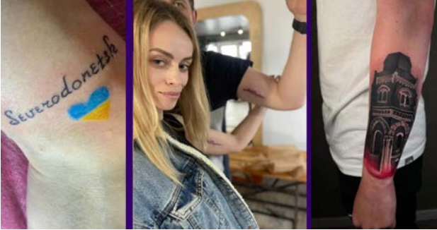
Рис. 2. Практика тілесного маркування: татуювання як акт меморіалізації

руйнується, індивід перетворює своє тіло на «місце пам'яті» (П. Нора) [11]. Знак сакралізується, стаючи оберегом, а межа між «військовим» і «цивільним» візуальними просторами розмивається через тілесну солідарність.