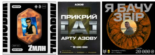
Рис. 4. «Візуальна коаліція»: синергія мілітарної айдентики та волонтерського дизайну

Висновки. В умовах сучасної війни мілітарна айдентика виходить за межі графічного дизайну. Масштабний «антропологічний зсув» перетворив символи на активних агентів ідентифікації та консолідації. Аналіз знака N («Ідея Нації») дозволяє виокремити три ключові аспекти цього процесу: