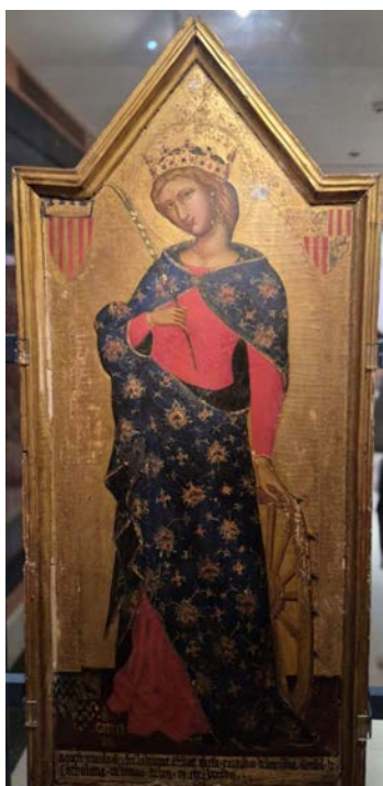
Рис. 9. Мартінус де Віланова. Каталонський вівтарний образ Св. Катерини. Католицький ізвод. Темпера на дереві, 1387 р.