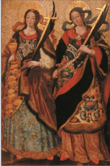
Рис. 14. Великомучениці Варвара і Катерина. 1740-ві рр. Північне Лівобережжя. Дошка липова, левкас, гравіювання, темпера, олія, сріблення, позолота. Колекція Національного музею українського мистецтва.

Окремим іконографічним ізводом Великомучениці синайської колекції є ікона «Епітафія Св. Катерини з житійними клеймами та віншувальними написами» 1805 р. (гобелен, шов, золота та срібна нитки), яка є варіантом «Успіння» означеної патронеси монастиря (Рис. 15). Іконографія Святої в Короні тут перегукуються з іконографією її образу на деці раки (Рис. 16), де зберігаються мощі Катерини Александрійської. Відмінністю її зображення на останньому є сувій у руках, який нагадує Скрижалі завіту, з відсилкою до одкровення через Мойсея.