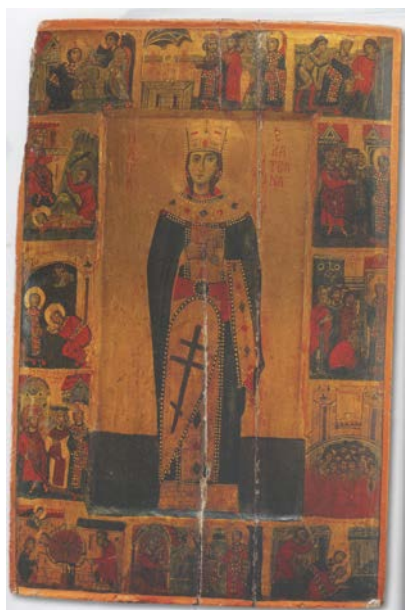
Рис. 8. Ікона «Житіє Святої Катерини з клеймами» (з благословляючою долонею), Синай. Візантійський ізвод. XIII ст. [10, с. 34]

бароко, коли цінувалася екзальтованість образів, більшої популярності порівняно з ізводом «Александрійська» набув ізвод «Великомучениця» (з колесом) (Рис. 11).