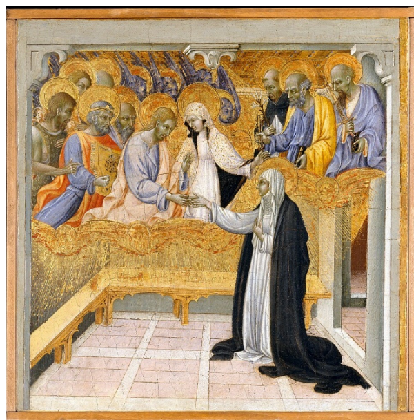
Рис. 1. Джованні ді Паоло, «Містичне заручення Святої Катерини», Музей Метрополітен, Нью-Йорк, бл. 1460 р.;

З новим іконографічним ізводом «Великомучениця» написали свої твори Рафаель Санті («Свята Катерина Олександрійська», 1507 р.), Гауденціо Феррарі («Мучеництво Святої Катерини», 1541–1543 рр.), Мікеланджело Мерізі де Караваджо («Свята Катерина Олександрійська», 1598–1599 рр.), які вводили у свої полотна та фресковий розпис знаряддя тортур та символи стійкості духу Святої.