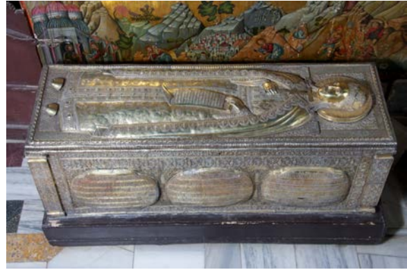
Рис. 16. Майстер Прокопій. Рака з мощами Св. Катерини. Монастир Св. Катерини, Синай. XVIII ст.

Висновки. Отже, Свята Катерина з доби Раннього Середньовіччя за матеріалами збірки Музею однойменного монастиря зображалась як мудра царівна, з вінцем із троянд (символ чистоти та цнотливості, атрибут Богородичного циклу), або у короні та царственних одежах, гідних візантійських імператорів – помазаників на землі (XI століття). Ранні ізводи грецького (афонського) походження мали аскетичну, статичну фігуру, єдиним атрибутом якої від XIII століття був щит, прикрашений хрестом, котрим для неї стала віра (в цьому ж образі голова героїня наділена благословляючим жестом, в якому одна долоня обернена назовні), а від XIV ст. – меч, через який завершилося земне життя Великомучениці. В цілому цей тип іконографічного ізводу можна назвати Александрійським.