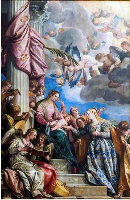
Рис. 3. Паоло Веронезе, «Містичне заручення святої Катерини», бл. 1575. Галерея Академії, Венеція.