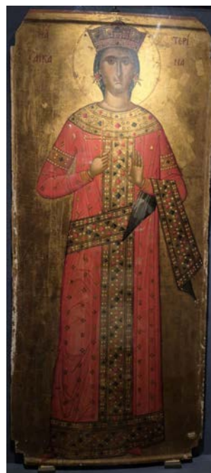
Рис. 10. Св. Катерина. Візантійський ізвод «Александрійська». Темпера на дереві. Друга половина XVI ст.