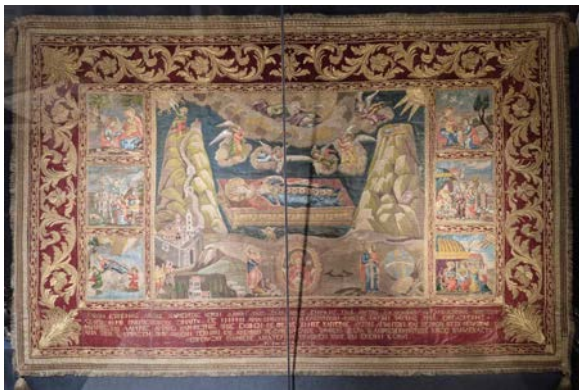
Рис. 15. Епітафія Св. Катерини з житійними клеймами та віншувальними написами. Гобелен. Віденське виробництво. Шовк, золота та срібна нитка, 1805 р.

Окремим іконографічним ізводом Великомучениці синайської колекції є ікона «Епітафія Св. Катерини з житійними клеймами та віншувальними написами» 1805 р. (гобелен, шов, золота та срібна нитки), яка є варіантом «Успіння» означеної патронеси монастиря (Рис. 15). Іконографія Святої в Короні тут перегукуються з іконографією її образу на деці раки (Рис. 16), де зберігаються мощі Катерини Александрійської. Відмінністю її зображення на останньому є сувій у руках, який нагадує Скрижалі завіту, з відсилкою до одкровення через Мойсея.