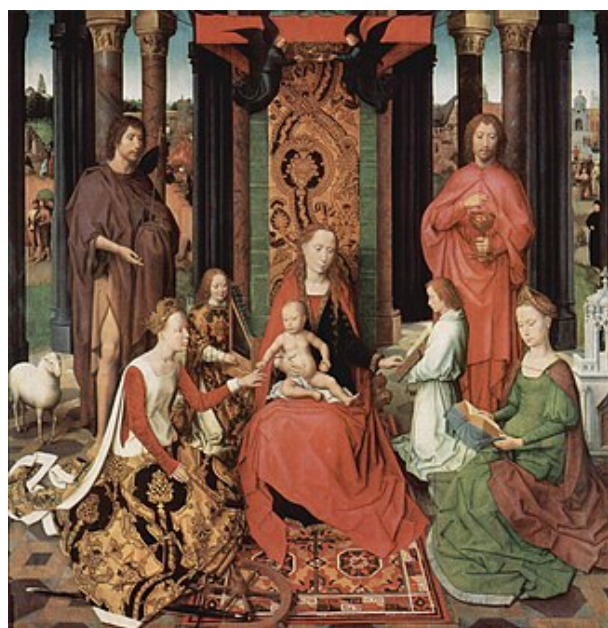
Рис. 2. Ганс Мемлінг, «Містичне заручення Святої Катерини», Брюгге, 1479 р.