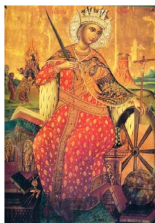
Рис. 11. Санта Каталіна, де Ієреміас Палладас, XVII ст. Ізвод «Великомучениця»

Враховуючи те, що Монастир Святої Катерини (Рис. 12) став центром автономної Православної церкви гори Синай, що додатково володіє низкою монастирських комплексів: трьома в Єгипті, дев'ятьма у Греції, трьома на Кіпрі, одним у Лівані, одним у Туреччині в Стамбулі, на іконографію ікон, які стікалися сюди, мали особливий вплив Афонська та Константинопольська школи.