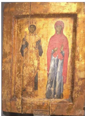
Рис. 5. Св. Катерина та Марина. Східна іконічна традиція. Темпера на дереві, XI століття

Крім грецьких православних каноніків, котрі здійснювали відправи у Монастирі Св. Катерини, поступово за незламну непохитність у своїх вчинках, чистоту, цноту, мудрість, цю святу почали шанувати і латиняни, що з часом призвело до єднання традицій зображення Святої у різних християнських конфесіях, подібно до ізводу Марії-семистрільниці [7].