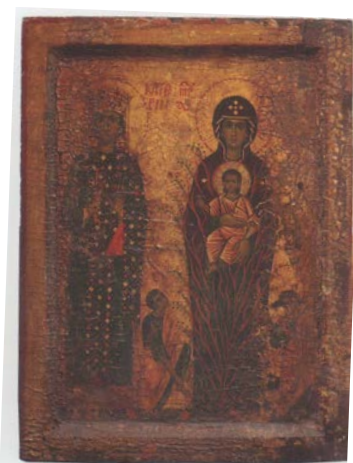
Рис. 6. Св. Катерина (з благословляючою долонею) та Діва Марія «Неопалима купина» з Немовлям Ісусом та Мойсеєм. Темпера на дереві. Ікона палігрівів. XIII століття. Репліка образу Св. Катерини X–XI століть періоду Македонської династії та Комнінів [10, с. 142]