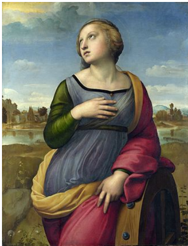
Рис. 4. Рафаель Санті, Свята Катерина Олександрійська. Олія на тополі, 1507 р.

Натомість, у православної традиції з Нового часу найбільш відомі два основні іконографічні ізводи Катерини з Єгипту – Олександрійська та Великомучениця. Перший тип був представлений доволі аскетичним, статичним образом Святої, виконаним у межах грецько-візантійської традиції. Найранішими прикладами такого типу іконографії є твір «Св. Катерина та Марина» XI ст. з колекції Музею Монастиря Святої Катерини на Синаї (Рис. 5) та репліка XIII ст. з прообразів X–XI ст. – «Св. Катерина (з благословляючою долонею) та Діва Марія "Неопалима купина" з Немовлям Ісусом та Мойсеєм» з цієї ж збірки (Рис. 6).