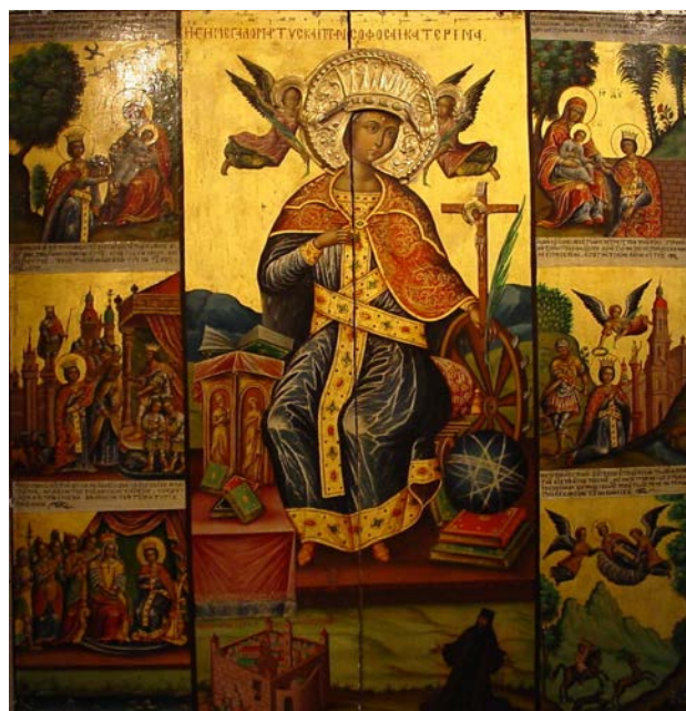
Рис. 13. Свята Катерина зі сценами її життя і смерті, виконана в традиціях візантійської іконографії. Ізвод «Великомучениця».

Останній є символічним стилізованим «Колесом Іезекіїля» (Іез. 1 і 10) – колеса в колесі, атрибута Божого промислу, й зустрічається в образах Христа-Пантократора, іконах Софії – Премудрості Божої. Світлі лінії, які перетинаються у ньому, передають ідею Божого управління світом на тлі Божественного мороку та нетварного світла та можуть інтерпретуватися як Фаворське світло й Божественне одкровення людині, яку оточують невігласи. Адже сказано у Писанні: «Бог мешкає у мороку» (3 Цар. 8: 12) (Рис. 13).