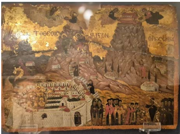
Рис. 12. Ікона «Синай та його святе місце» з зображенням Монастиря Святої Катерини. Лакована темпера на дереві. Перша чверть XVIII сторіччя.

Культ патронеси монастиря від Середньовіччя мав широке поширення в Європі. Колекція ікон катерининського циклу не постраждала тут у добу іконоборства, оскільки знаходився за межами Візантійської імперії від VII ст.